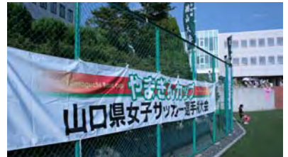
大学グラウンドで実施されました

キーパーとして全国の舞台で活躍された実績をお持ちの方で、徳山大学の卒業生でもあります。現在は、私たちの指導をされる傍ら、徳山大学で再度体育教員の教職課程を履修され、非常に多忙な日々を送られています。このような、コーチのひたむきな姿も、私たちに