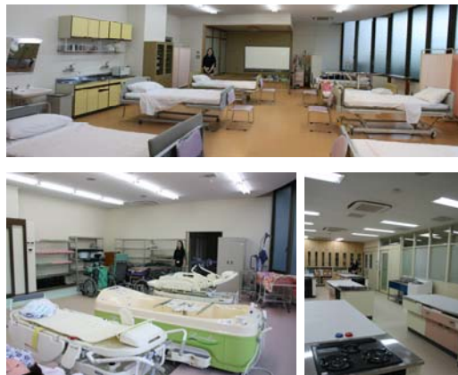
写真上 本学の介護実習施設

2008年4月から徳山大学福祉情報学部 に着任。担当科目は社会福祉援助技術演習 I(介護技術)・整容福祉・介護入門。