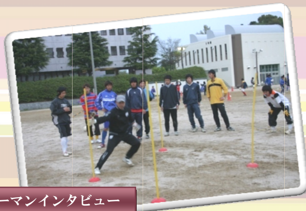
ヒューマンインタビュー